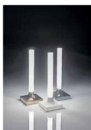
Die neue Interpretation des Kerzenscheins von Design-Star Philippe Starck. Mit der Leuchte „Goodnight“ bringt er stimmungsvolles Licht ins Wohn-Ambiente.

Die Zusammenarbeit mit der italienischen Design-Schmiede „Kartell“ hat für Philippe Starck bereits Tradition. Nach seinen Entwürfen für den ikonischen Stuhl „Louis Ghost“ oder den wetterfesten Sessel „Bubble“ ist jetzt das Licht in seinen Fokus gerutscht. Vor allem der Kerzenschein hat es ihm dabei angetan. „Das Licht der Kerzen war schon immer das schönste und natürlichste Licht“, sagt er und verleiht dem heimeligen Schein nun eine neue Dimension. „Goodnight“ ist eine Lampe, die es sowohl in Wandausführung als auch besonders gelungen in einer mobilen Version gibt. Dabei überzeugt nicht nur das edle Design, sondern auch die lange Leuchtdauer. Einmal aufgeladen erstrahlt „Goodnight“ bis zu 40 Stunden lang und kann in drei Stufen gedimmt werden. Die Basisteile der in sechs Farben erhältlichen Leuchte werden aus recyceltem Material gefertigt und passen sich somit an viele Einrichtungssituationen an.