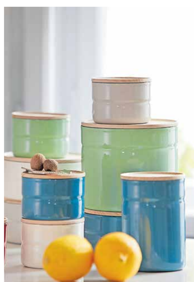
Robustes Emaille ist langlebig und zeitlos.

Der Gedanke der Nachhaltigkeit paart sich zudem mit schlichter Eleganz – beispielsweise bei der 280 Gramm fassenden Lunchbox „To go & to stay“ von Villeroy & Boch, die mit ihrem klaren Weiß einen schönen Akzent in jeder Küche setzt. Sie ist aus hochwertigem Premium-Porzellan, was ja für sich genommen schon ein Statement ist. Die Box ist mittels Porzellandeckel und Silikonabdichtung gut verschließbar, spülmaschinen- und mikrowellenfest. Die geruchs- und geschmacksneutrale Aufbewahrung spielt eine ebenso große Rolle wie der schadstofffreie und hygienische Einsatz im Alltag. Nachhaltig und formschön ist auch die Aufbewahrungsbox der japanischen Firma Honeyware, die seit 1947 produziert: Die Frischhaltebox aus Emaille ist für jede Herdart geeignet und geschmacksneutral. Die Box kann auch als Ofenform verwendet werden – Temperaturen von bis zu 400 Grad Celsius sind für das Material kein Problem. Zudem ist die Emaillebox spülmaschinengeeignet, ein klarer Vorteil liegt auch im geringen Gewicht. Von diesen Punkten profitieren auch die feinglatten Produkte von Riess: Der Premium-Emaille-Hersteller aus Österreich, der seit 1550 Glas und Eisen im Brennofen bei 850 Grad Celsius untrennbar miteinander verschmelzen lässt, stellt hochwertiges, handgefertigtes Kochgeschirr her. Gesundes Aufbewahren, Kochen und Backen sind damit garantiert. Fazit: Zeitlos schöne, nachhaltige Geschenke für Freunde von wertigen Aufbewahrungsmöglichkeiten, die im wahrsten Sinne des Wortes geschmackvoll sind.